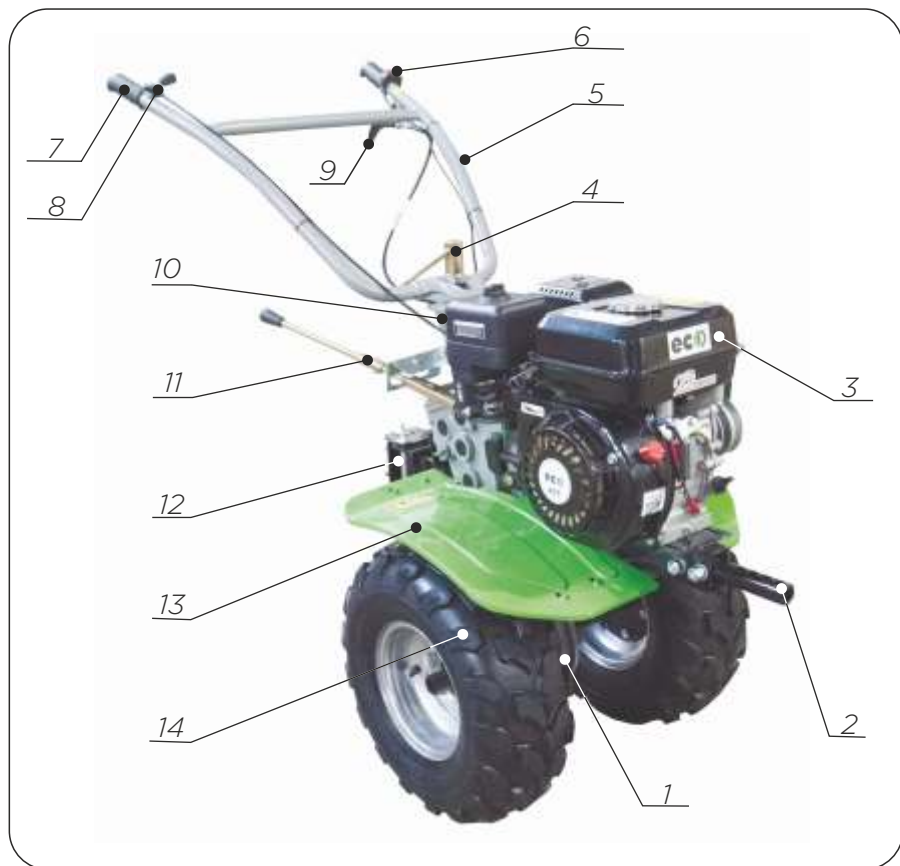
Рис.1 Мотоблок (общий вид)