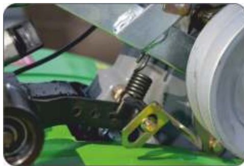
Рис. 11 (Кожух защитный снят)